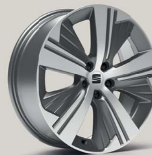
EXCLUSIVE 37/1 MACHINED AEROWHEELS XC