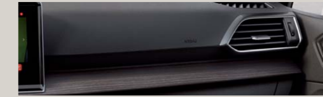
CZARNO-SZARA TAPICERKA MATERIAŁOWA Z BRĄZOWĄ ALCANTARĄ I BRĄZOWYM PRZESZYCIEM Xc