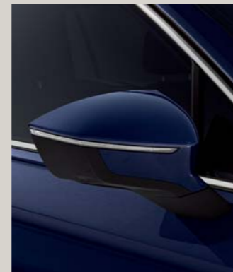
ATLANTIC BLUE 2