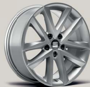
DYNAMIC 37/1 St