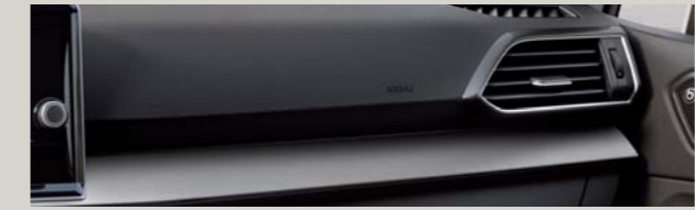
CZARNO-SZARA TAPICERKA MATERIAŁOWA Z ELEMENTAMI Z CZARNEJ ALCANTARY St