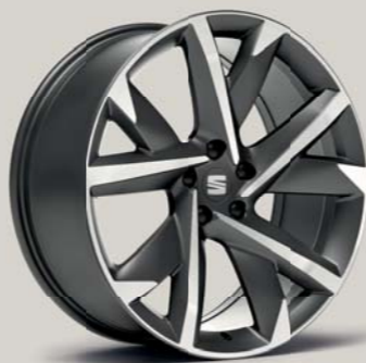
COSMO 37/1 COSMO GREY MACHINED FR

Style St Xcellence XC FR FR Wyposażenie standardowe ■ Wyposażenie opcjonalne ■