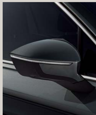
DARK CAMOUFLAGE 3,4