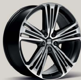
SUPREME 37/1 MATT MACHINED XC