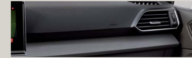
TAPICERKA CZARNA SKÓRZANA I CZERWONYM PRZESZYCIEM FR