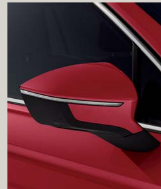
MERLOT RED 2,4