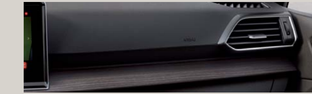
TAPICERKA CZARNA SKÓRZANA Xc