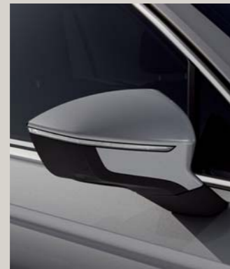
REFLEX SILVER 2