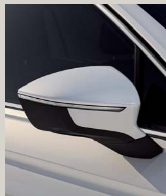
ORIX WHITE 3,4