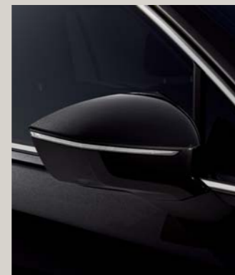
DEEP BLACK 2,4