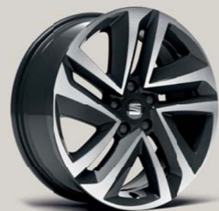
PERFORMANCE 37/1 St