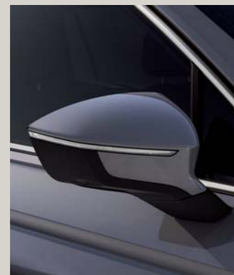
DOLPHIN GREY 2,4