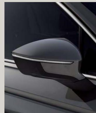
URANO GREY 1,4