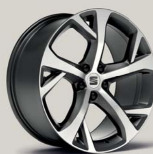
EXCLUSIVE 37/1 COSMO GREY FR